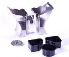
Thekeneinbauvorrichtung Tarkivid leti külge kinnitamiseks