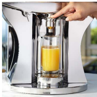
Roostevabast terasest kuulkraan