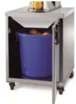
Unterbauwagen (mobil) Ratastega mobiilne aluskäru